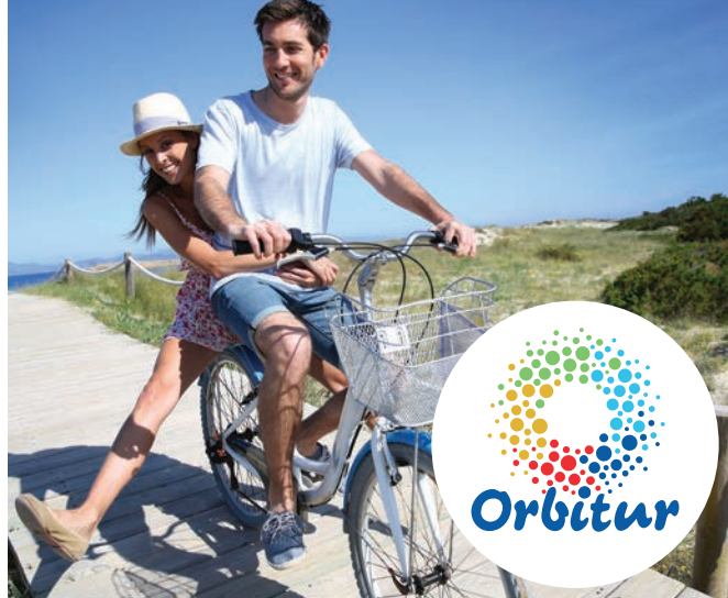
Tabela de Preços Price List (a) 2018